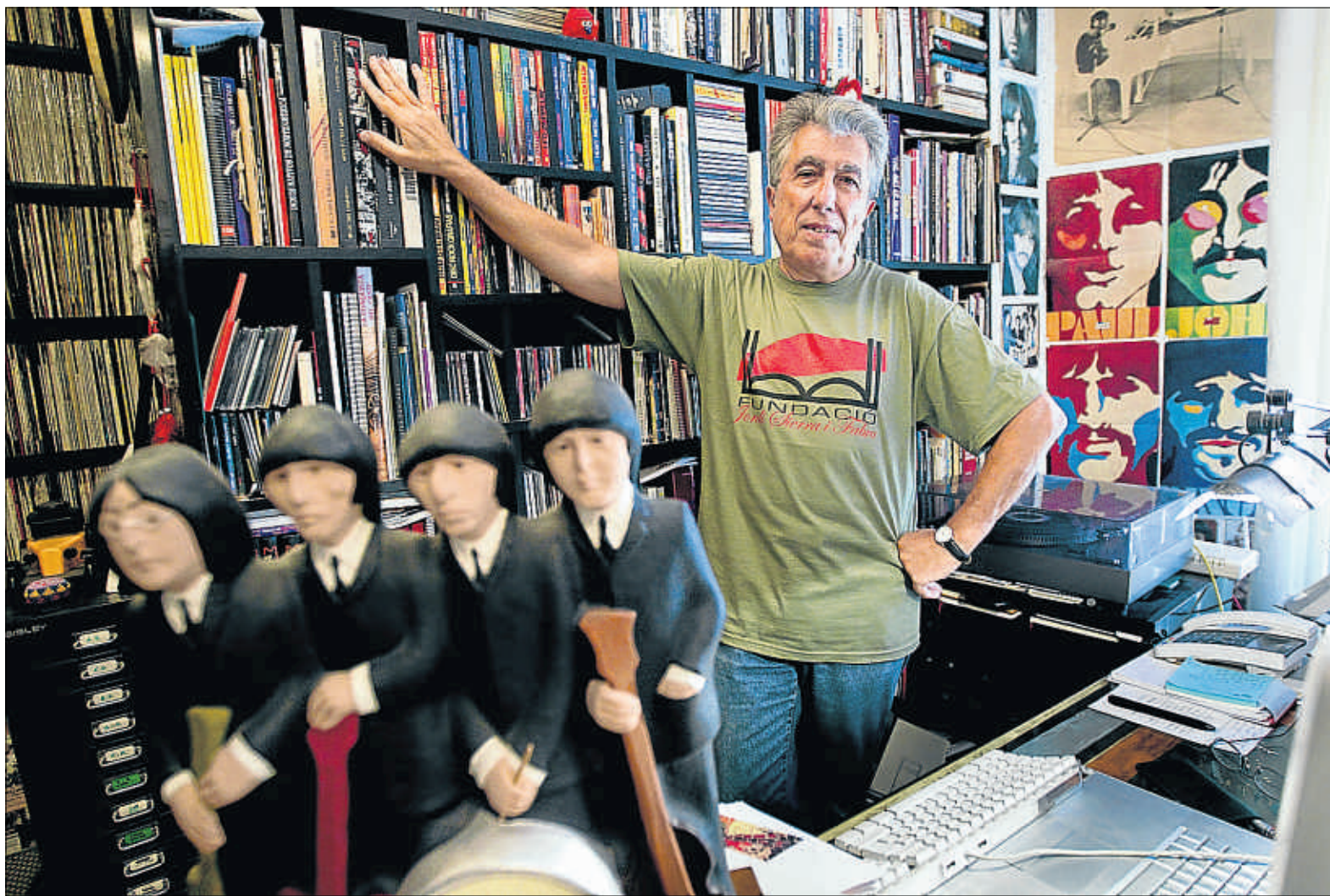
Jordi Sierra i Fabra, fotografiado esta semana en el atestado despacho de su domicilio barcelonés

El resultado estará a la vista del aficionado y del eventual comprador el próximo viernes, fecha en que sale a la venta coincidiendo con aquel aniversario. La nueva versión está editada ahora por EDAF, tiene formato de single y está profusa y lujosamente ilustrada. Lógicamente está ampliado con el día a día de los protagonistas de estos últimos diecisiete años. Además, también existirá una versión electrónica del volumen. De idéntico título y contenido escrito, la obra estará publicada por la editorial Hakabooks, y contendrá otras imágenes, éstas procedentes del archivo personal del autor.